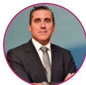
CARLES RECASENS LAGUARDA

Presidente del Colegio de Médicos de las Islas Baleares